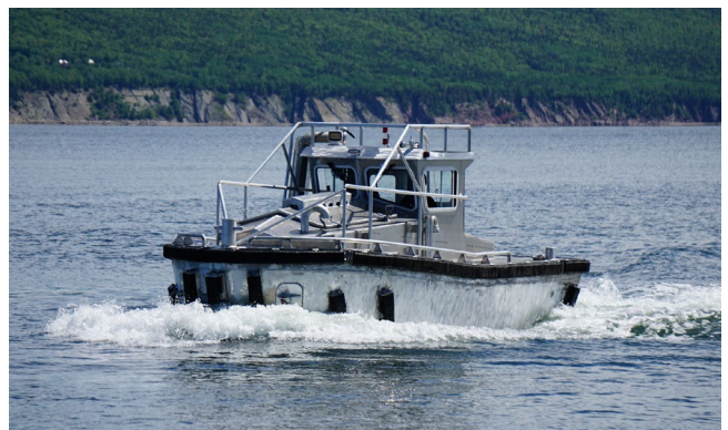
Figure 1 & 2 – Essais en mer au Chantier Naval Forillon